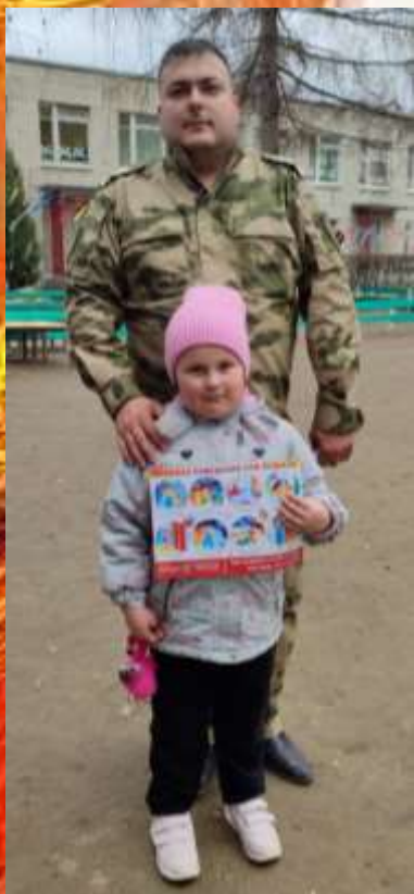
Памятка «Правила пожарной безопасности»

Педагоги дали рекомендации родителям, как знакомить детей с правилами пожарной безопасности, напомнили, как нужно правильно вести себя при пожаре, раздав памятки «Правила пожарной безопасности».