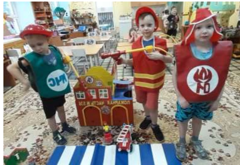
Сюжетно-ролевая игра «Служба спасения»