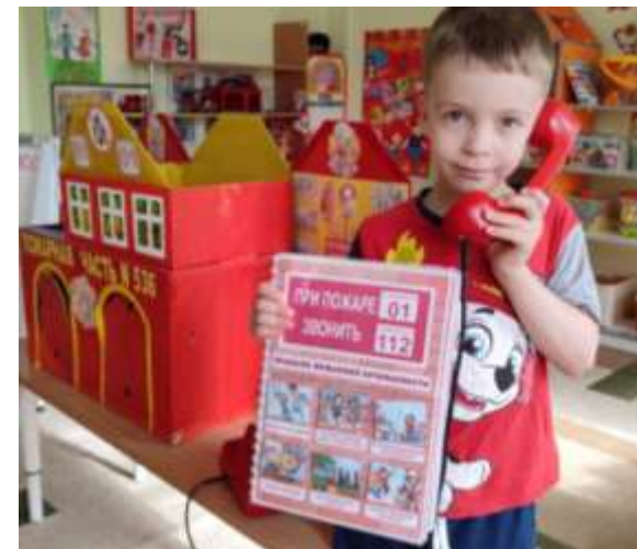
Сюжетно-ролевая игра «Знает каждый гражданин, этот номер 01».