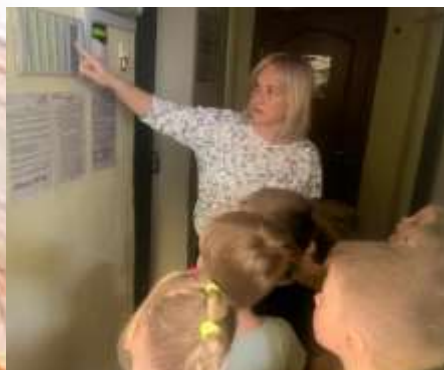
Экскурсия по детскому саду