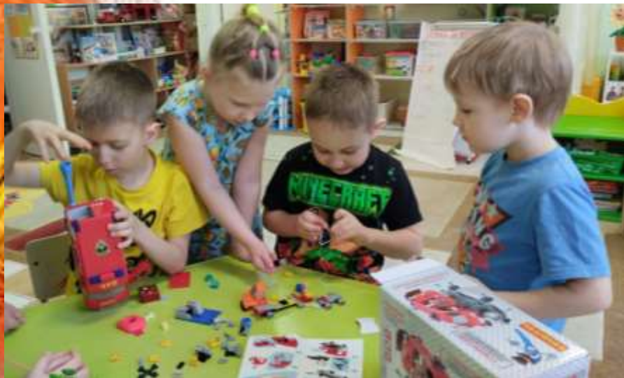
Конструирование «Пожарная машина»