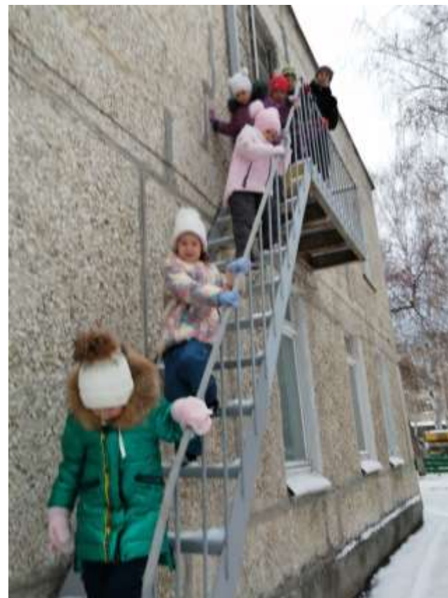
Провели плановую эвакуацию