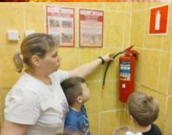
«Знакомство с огнетушителем»

Научились правильно набирать номер по телефону и давать точные и четкие ответы на вопросы, дети запомнили общепринятые правила разговора по телефону, в том числе с дежурными экстренных служб.